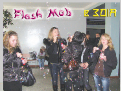
Flash Mob в ЗДІА