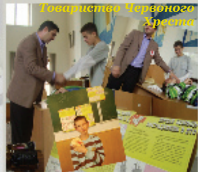
Товариство Червоного Хреста