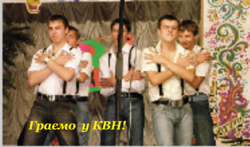
Граємо у КВН!