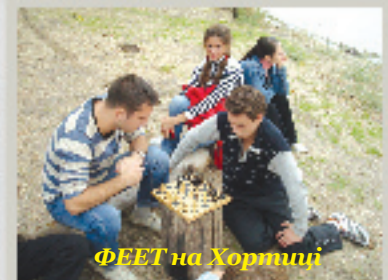
ФЕЕТ на Хортиці