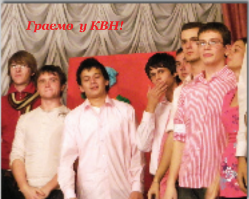
Граємо у КВН!