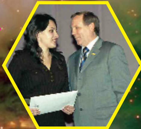
Староста кращої групи...