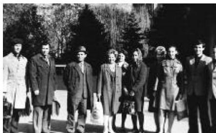
Після трудового тижня...