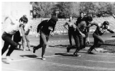
У здоровому тілі – здоровий дух...

Викладачі кафедри вдало поєднують традиційні форми навчання та новітні технології навчально-виховної роботи (модульно-рейтингова та кредитно-модульна системи навчання), постійно вдосконалюють форми та методи індивідуальної роботи зі студентами. Кафедра ПБМ – дружний колектив викладачів та співробітників, який завжди відгукується на нові вимоги навчально-виховного процесу, на громадські справи, спортивні змагання, з інтересом організовує культурний відпочинок.