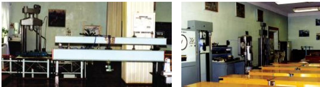
Навчальна лабораторія з опору матеріалів