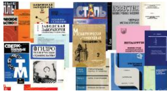
Наукові праці викладачів та співробітників кафедри