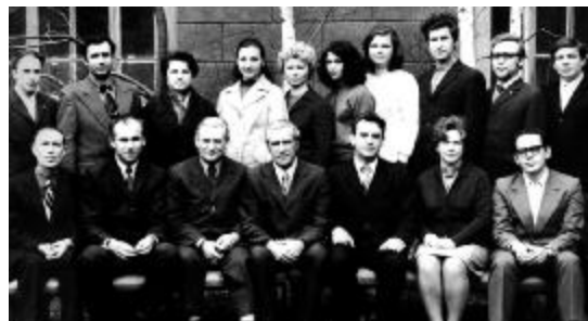
Кафедра будівельної та прикладної механіки, 1972 р.