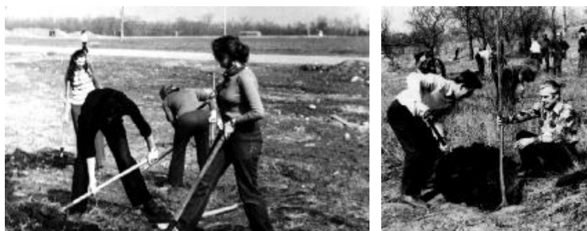
Громадська робота навчальній не заважає...