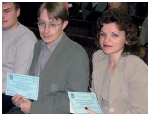
Молоді вчені – стипендіати мера м. Запоріжжя