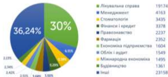
Рис. 4. Трендові спеціальності для іноземних студентів (на 01.01.2016)

5. Зміна попиту на спеціальності. Найбільш престижною для іноземних студентів (40 %) є медичні та фармацевтичні спеціальності. Сегмент інженерно-технічних спеціальностей України потребує підтримки та грамотного маркетингу в глобальному освітньому просторі.