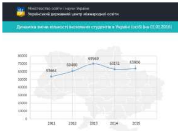
Рис. 2. Динаміка зміни кількості іноземних студентів в Україні (осіб) на 01.01.2016 р. [6].

3. Зменшення кількості іноземних студентів, що навчаються в Україні. За останні 2 роки відбулось зменшення кількості іноземних студентів, що навчаються в Україні. Абсолютні показники зменшення – 6063 (8,7%) осіб [6].