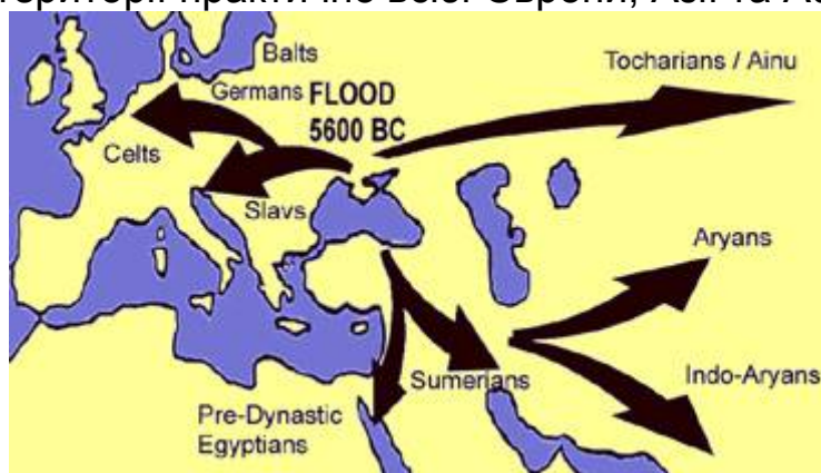
Рис. 1 – Карта розселення нордичної раси з території України (Artur Camp. March of the Titans. A History of the White Race. – USA, Ostara Publications, 1999)

Це підтверджується і висновками американського вченого А.Кемпа, який на основі археологічних та історичних матеріалів відтворив карту першого глобального розселення нордичної (білої) раси з території України, починаючи з VI тис. до н.е. [32]. З цієї карти (рис.1) ми можемо побачити, що наші пращури в VI тис. до н.е. розселилися на території практично всієї Європи, Азії та Африки.