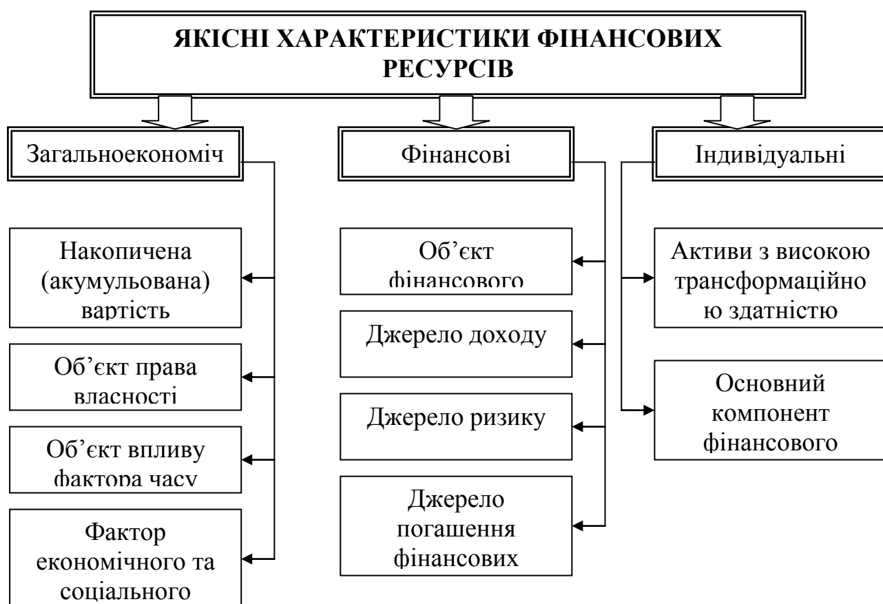
Рисунок 1 – Якісні характеристики фінансових ресурсів

В оптимальному варіанті передбачається, що обігові кошти підприємств фінансуються за рахунок довгострокових пасивів, а основні та прирівняні до них засоби фінансуються за рахунок довгострокових джерел. Завдяки цьому оптимізується загальна сума витрат щодо залучення коштів.