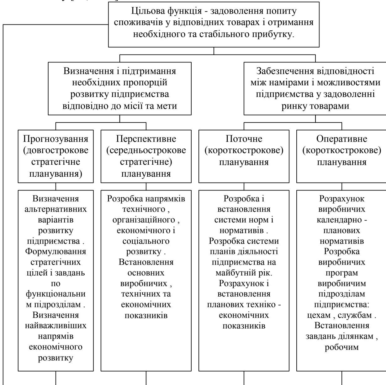
Рисунок 3 – Схема реалізації системи планування на підприємстві

Висновки. Кожне підприємство, незалежно від масштабів і виду діяльності, кожна підприємницька структура в умовах ринкового господарювання займається плануванням. Відсутність планів супроводжується помилковими маневрами, несвочасною зміною орієнтації, що призводить до втрати позицій на ринку, нестійкого фінансового стану, банкрутства підприємства. Практика господарювання свідчить про те, що ефективне планування на підприємстві неможливе без створення його системи, з своїми цілями, завданнями та принципами, які мають підтримувати цілі самого підприємства. На сучасному етапі стоїть завдання подальшого удосконалення системи планування та системи показників планів, підсилення їх впливу на підвищення; науково-технічного рівня виробництва і якості продукції,