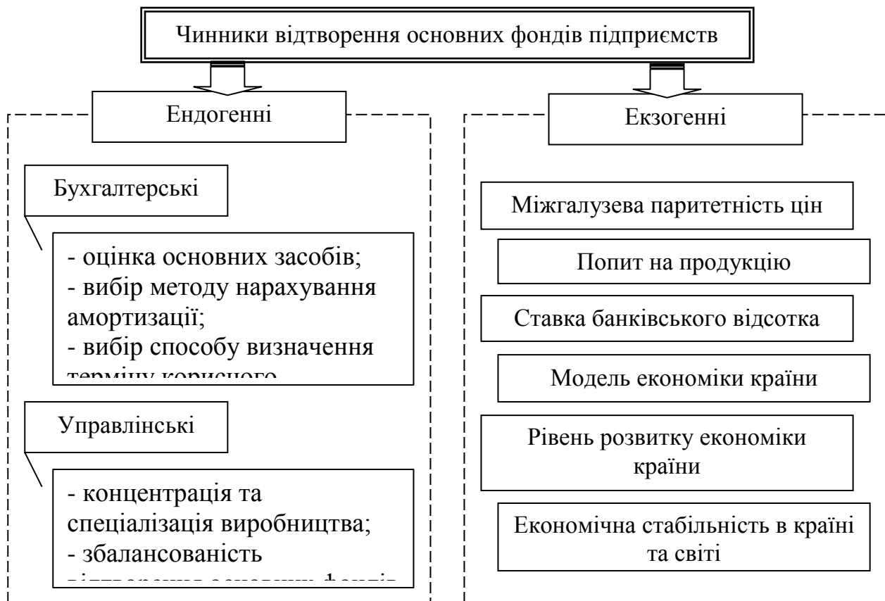
Рисунок 1 – Класифікація чинників відтворення основних фондів

Для забезпечення ефективності відтворення основних фондів велике значення має також дослідження класифікацій факторів, які впливають на цей процес. На наш погляд, однією з найважливіших серед них є класифікація, яка розподіляє фактори ефективності відтворення основних фондів на ендогенні (залежать від конкретного підприємства) та екзогенні (зумовлені зовнішніми причинами). Класифікація факторів представлена на рисунку 1.