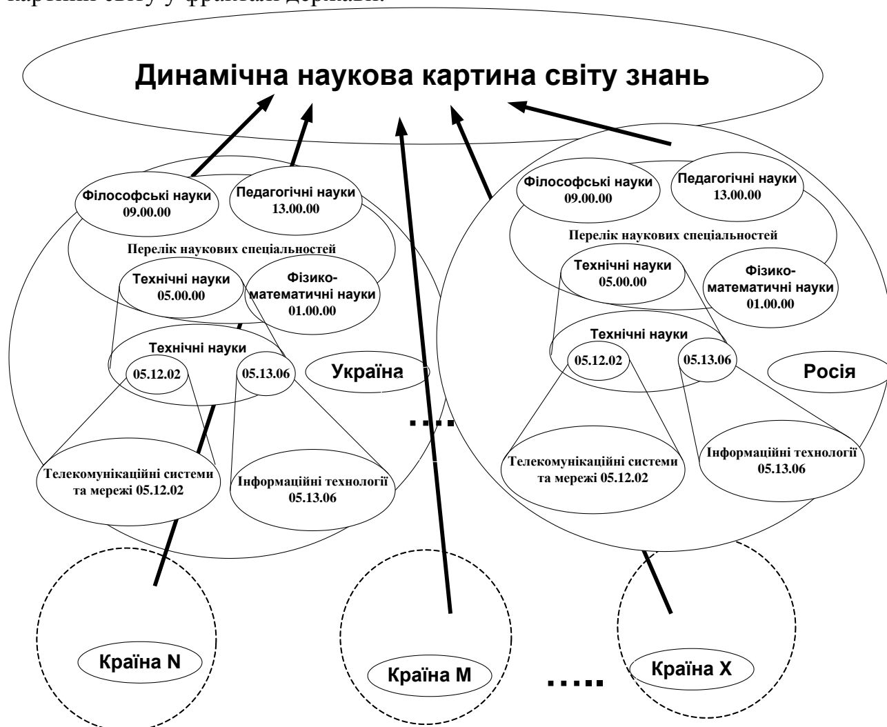
Рис. 2. Фрагмент фрактального повного уявлення про фрагмент наукової картини світу в частині, що стосується реального наукового пізнання вченими

дослідження (рис. 2). Опускаючись нижче до сукупності фрактальних систем підготовки НК НПК, ми отримаємо методологічну фрактальну модель наукового пізнання наукової картини світу в межах загальнодержавної на етапі підготовки НП НПК (дисертаційного дослідження), науковому пошуку в процесі професійної трудової діяльності (рис. 3). Отже, ця модель є і інформаційним каналом збагачення наукової картини світу у фракталі держави.