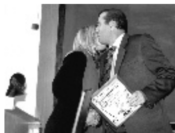
Організаційно-виховний відділ.